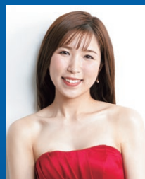
南 さゆり (ソプラノ)